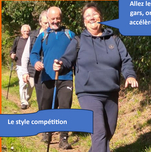
Le style compétition