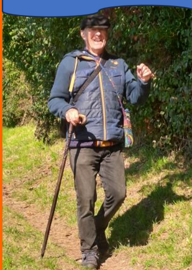
Le style anglais